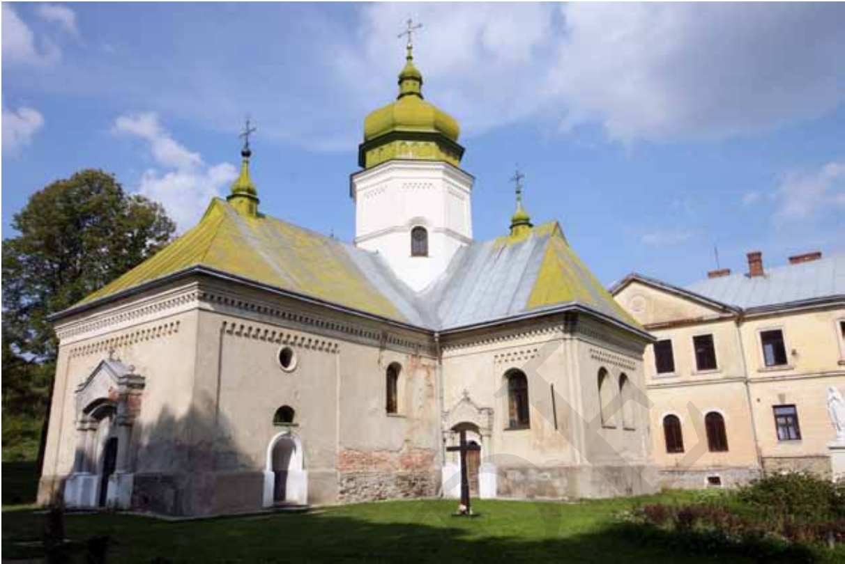
Церква Святого Онуфрія Великого. Друга половина XIII / початок XIV – початок XX ст. Святоонуфрієвський монастир. с. Лаврів Львівської обл.