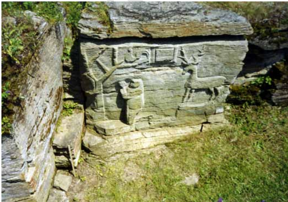
Рельєфний образ «Моління святого Онуфрія Великого в пустелі». Перша половина XVII / початок XVIII ст. Скельний монаший осідок. с. Буша Вінницької обл.