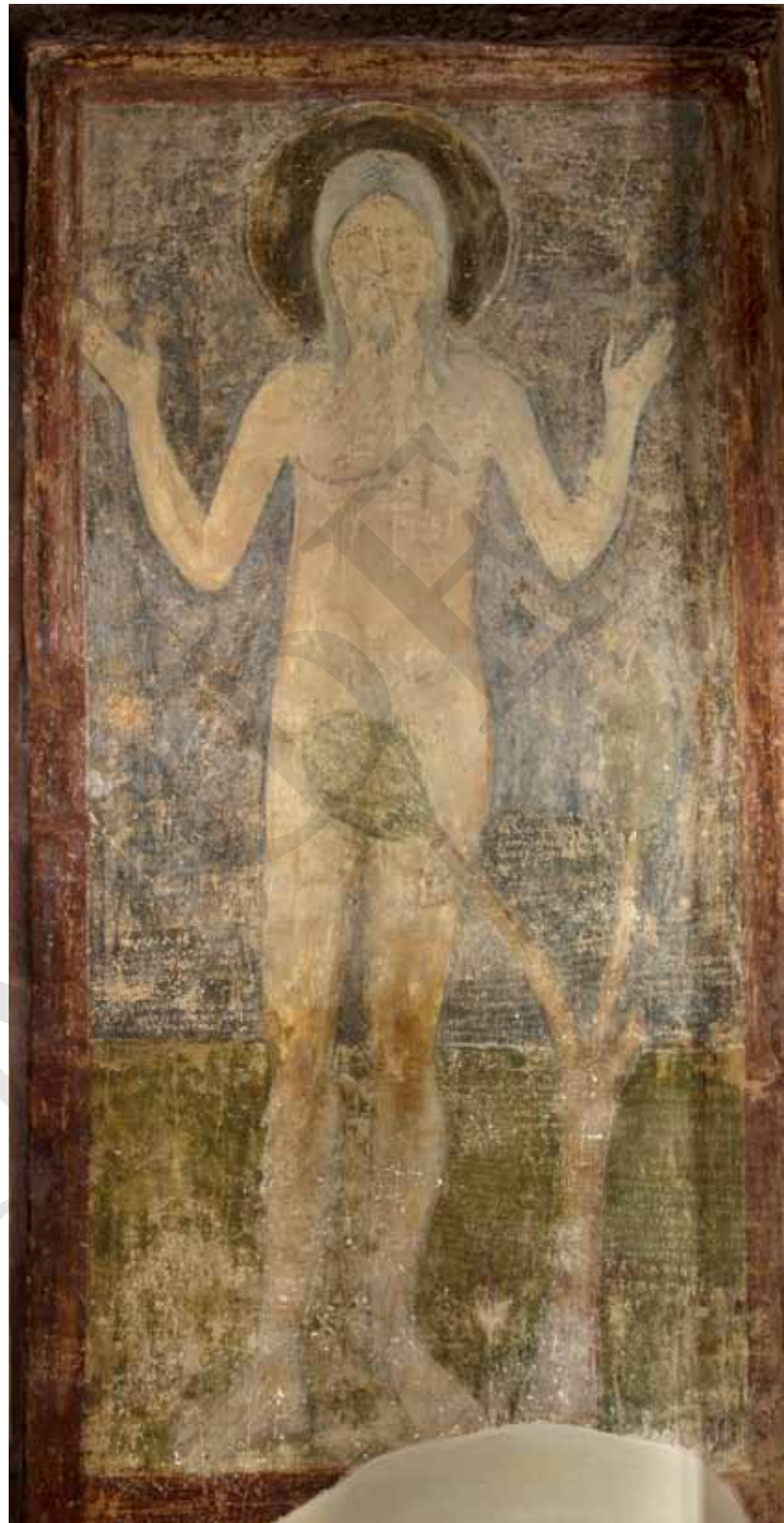
Образ Онуфрія Великого (Єгипетського). Перша половина / середина 40-х рр. XI ст. Зовнішня південна галерея Софійського собору. Київ.