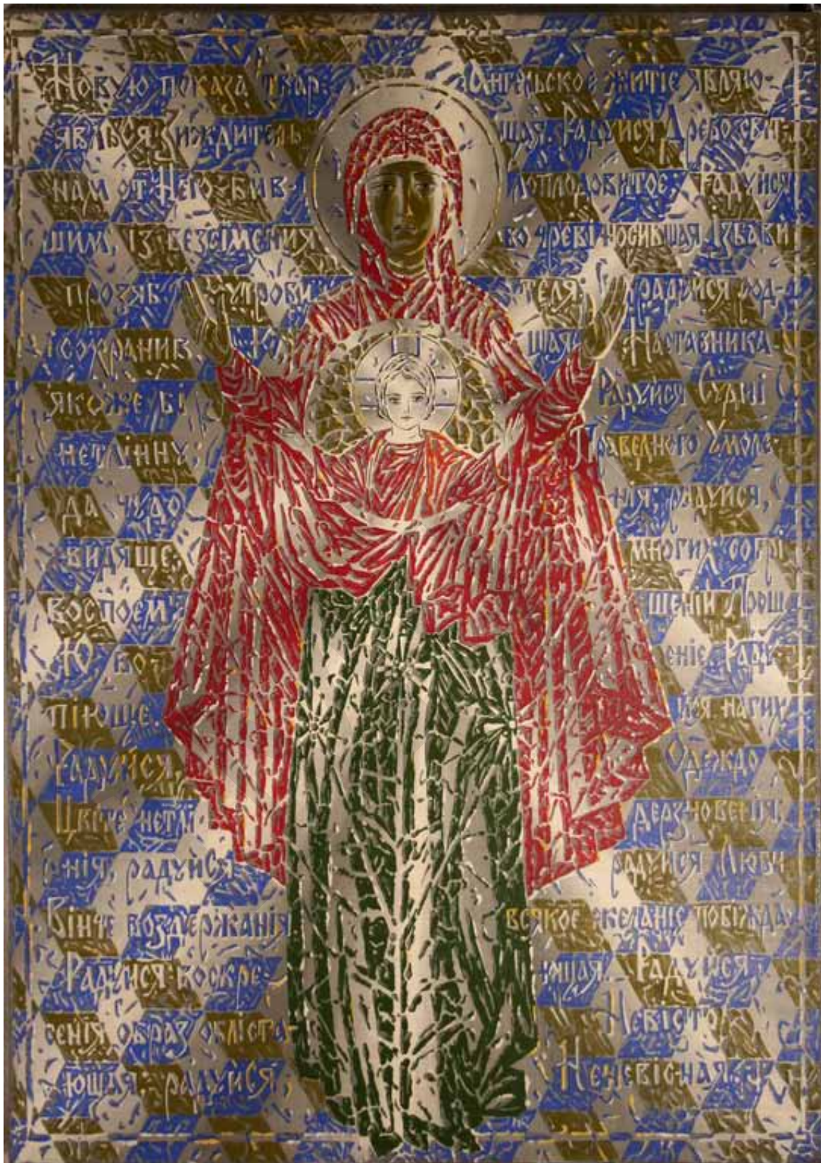
В. Химочка. Показав Нову Твар. 1994 р. Полотно, акрил. 100 × 75