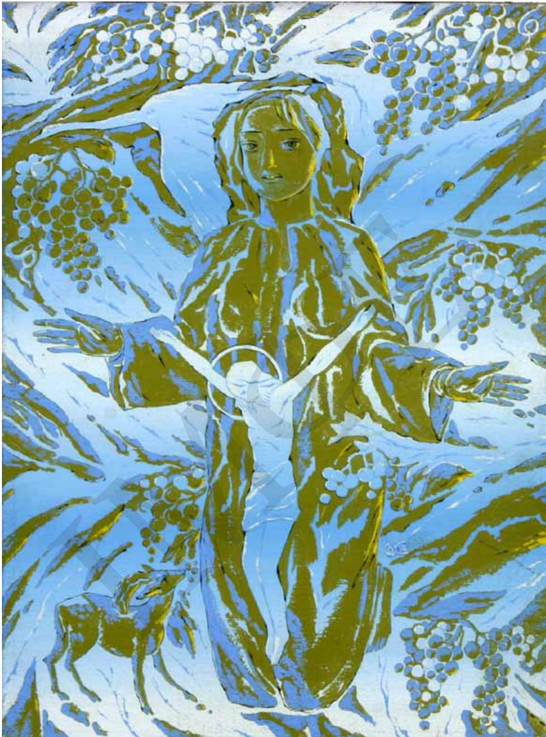
В. Химочка. Остання Тайна. 1998 р. Полотно, акрил. 30 × 40