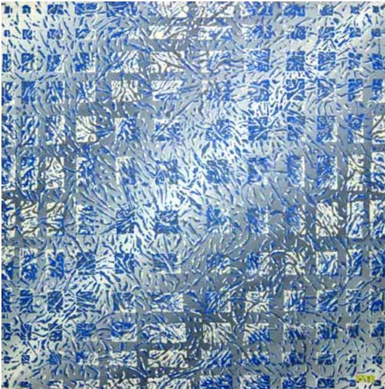
В. Химочка. Брама. 1993 р. Полотно, темпера. 70×70