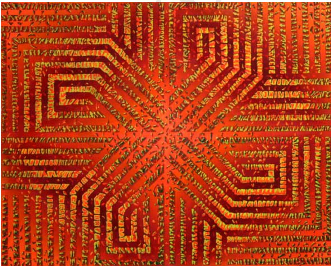
В. Химочка. Сварга. 2008 р. Полотно, акрил. 100 × 80