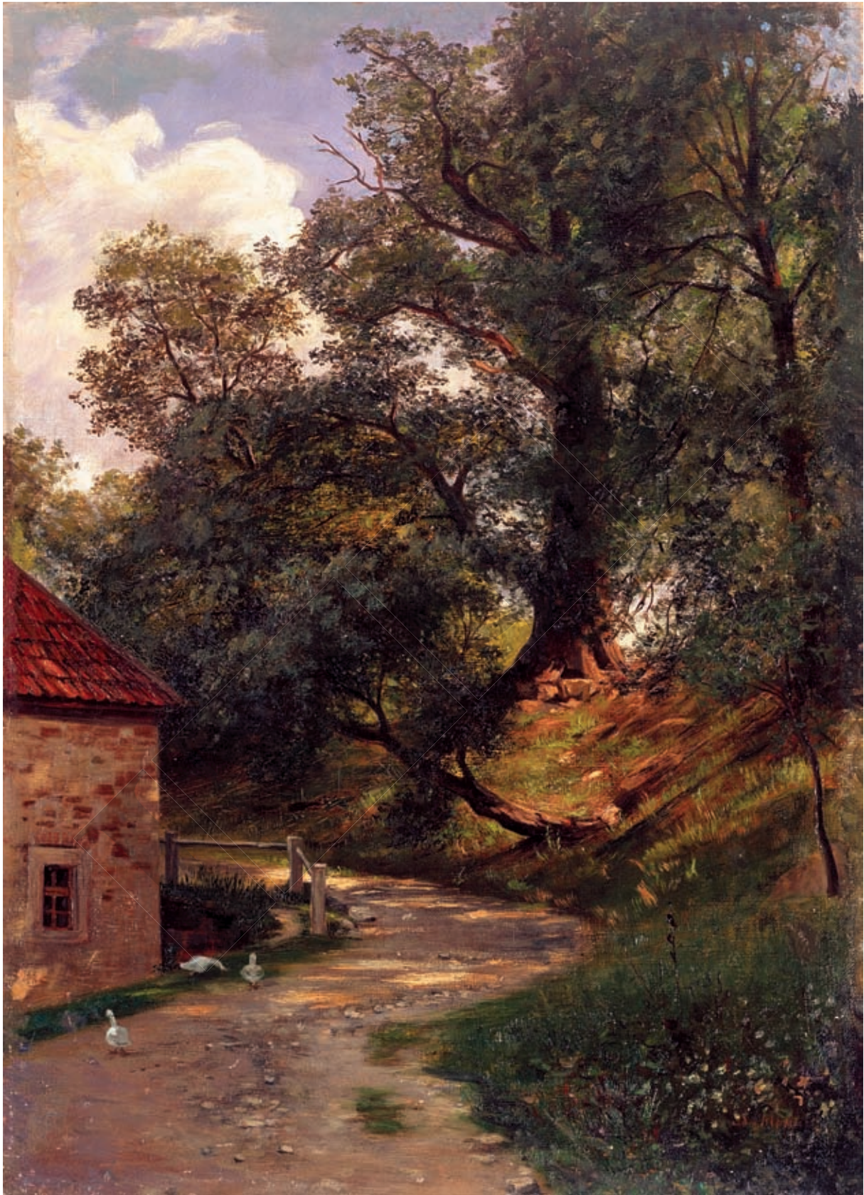
В. Менк. Двір. Полотно, олія. НХМУ