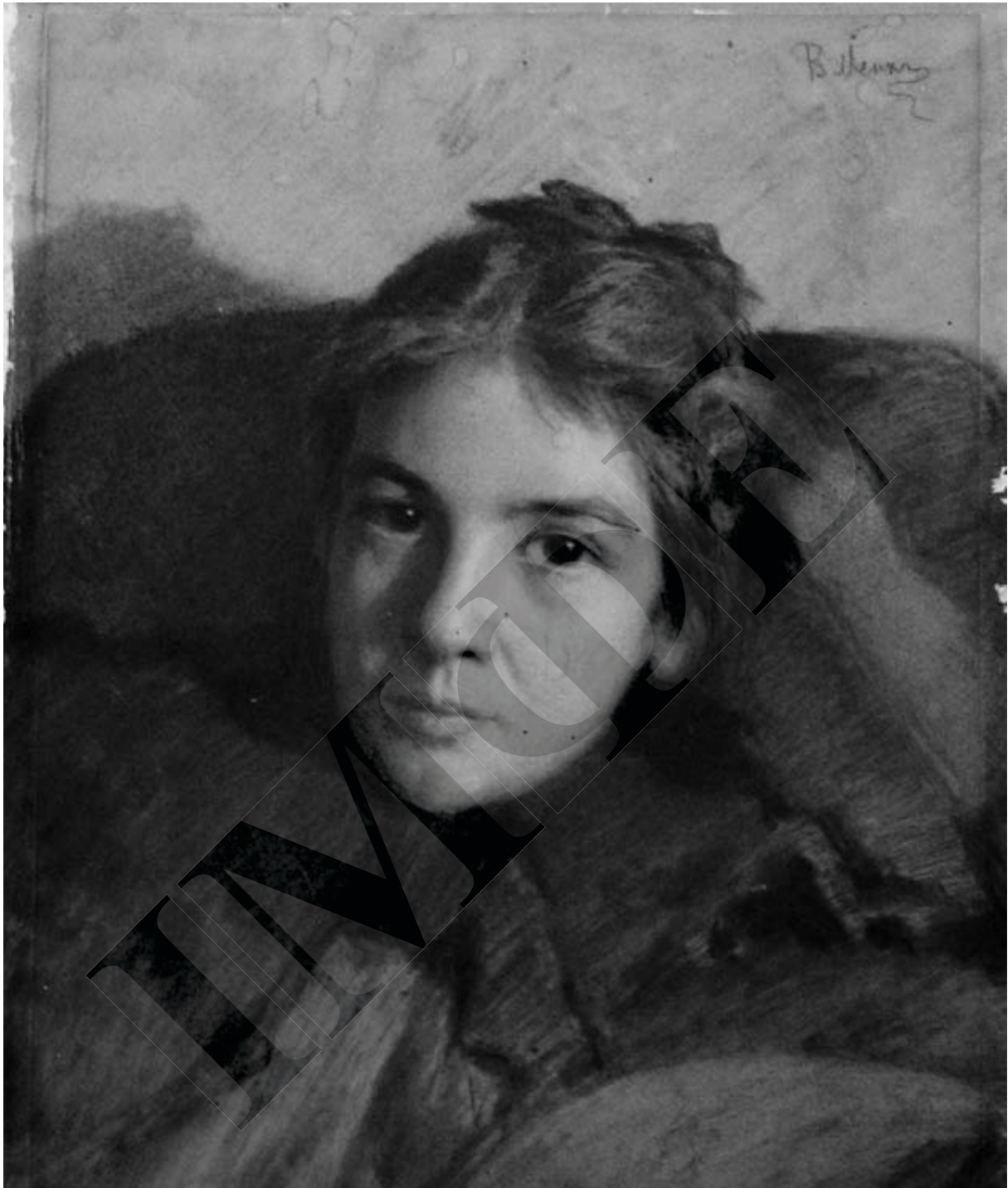
В. Менк. Портрет дружини. Папір, наклеєний на картон, вугілля, соус. НХМУ