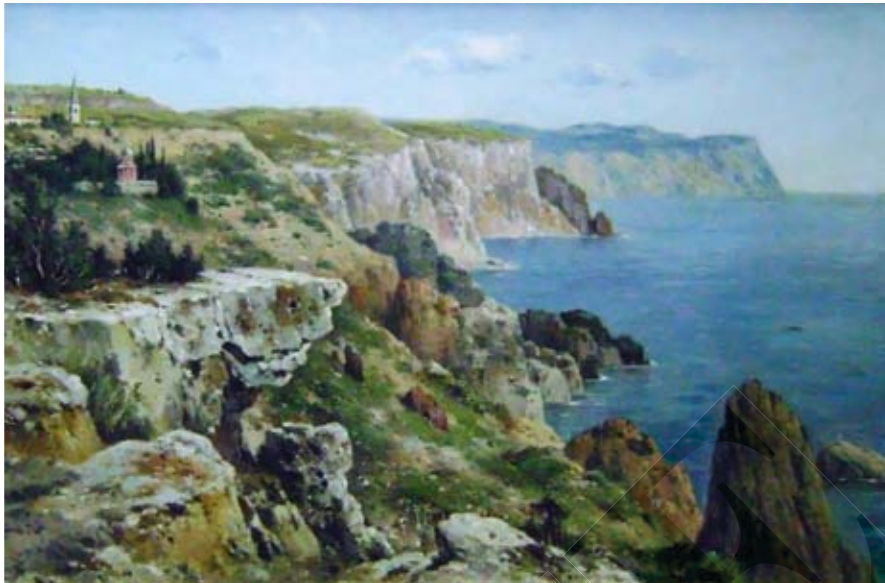
В. Менк. Кримське узбережжя. 1896 р. Полотно, олія. НХМУ