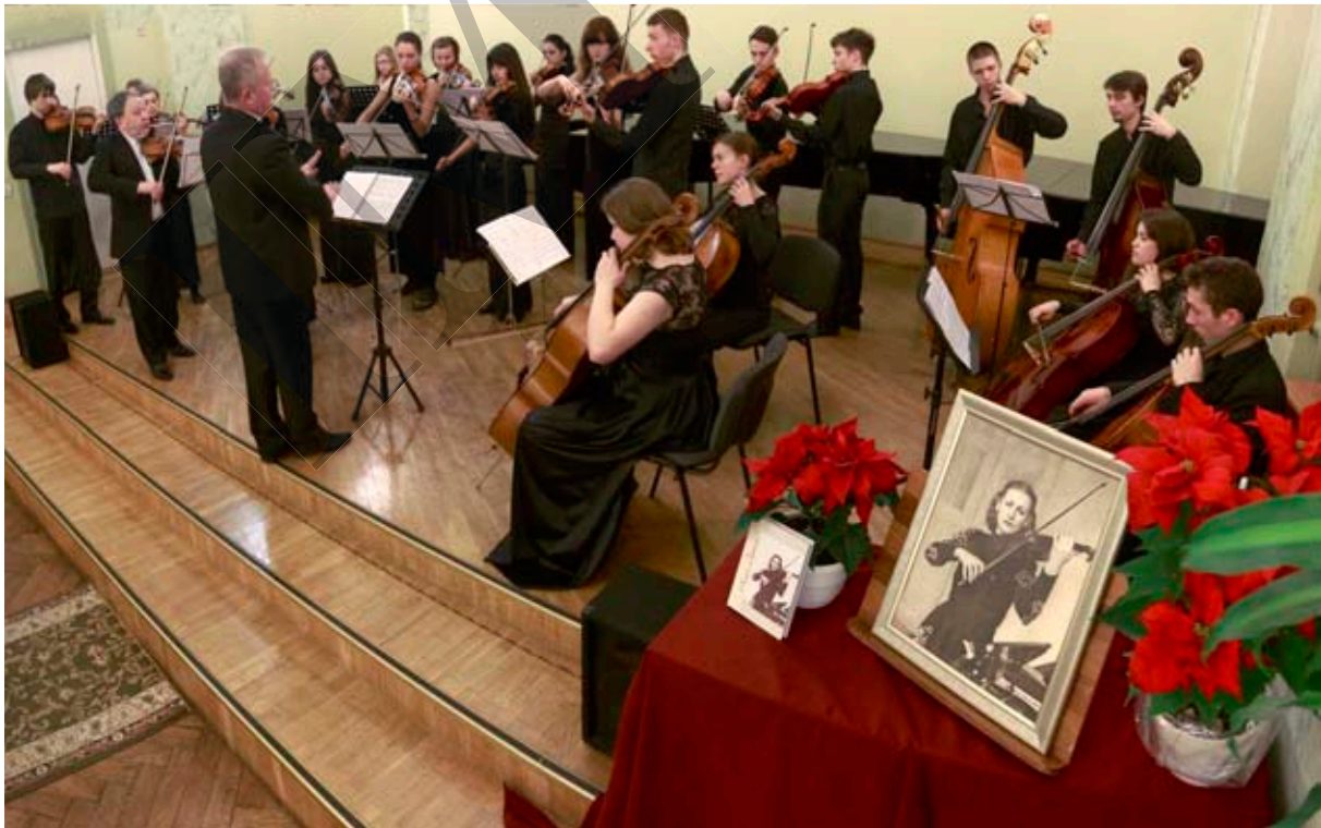
Урочистий вечір «До 90-річчя від дня народження Лесі Деркач». Львівський камерний оркестр «Академія». 10 грудня 2014 р. Великий зал ЛНМА ім. М. В. Лисенка