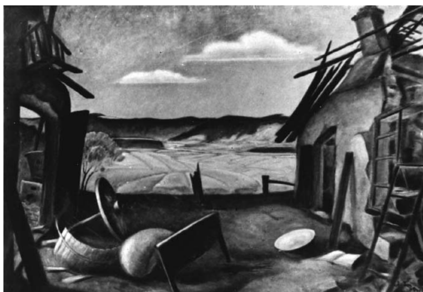
Л. Гец. Новонароджений. Із циклу 5-ти картин «Війна». Сянок. 1942. Олія, 150 × 100