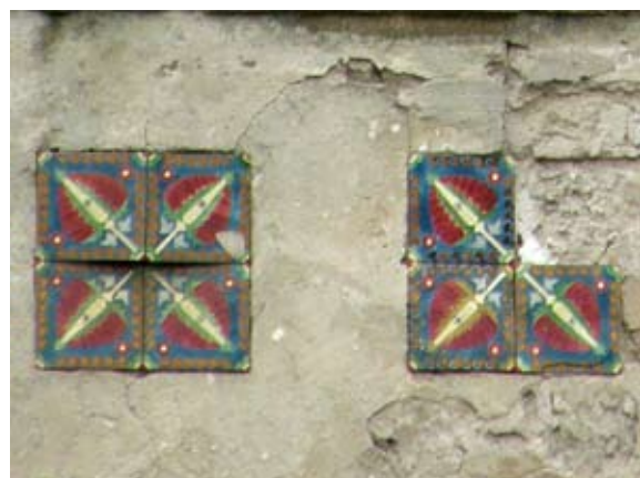
Вул. Долинського, 10–11