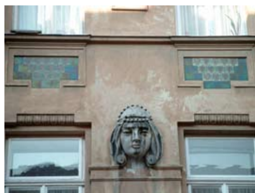
4 – вул. Тарнавського, 6–8