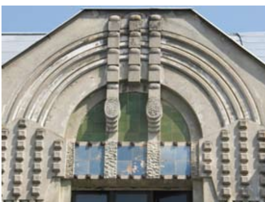
7 – вул. Донцова, 8–10