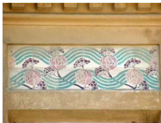
Вул. Личаківська, 70 (1906 р.)