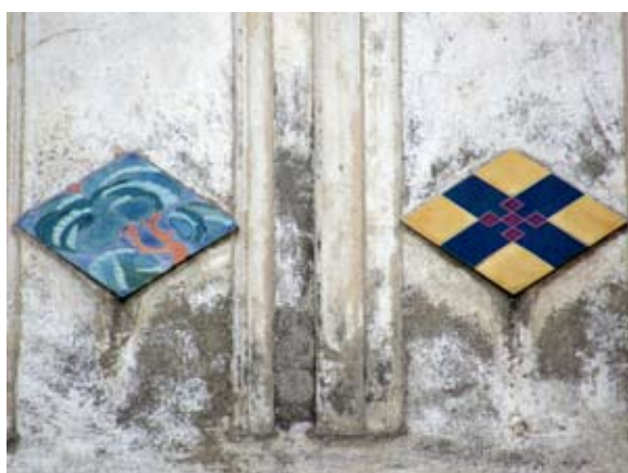
Вул. Бандери, 33