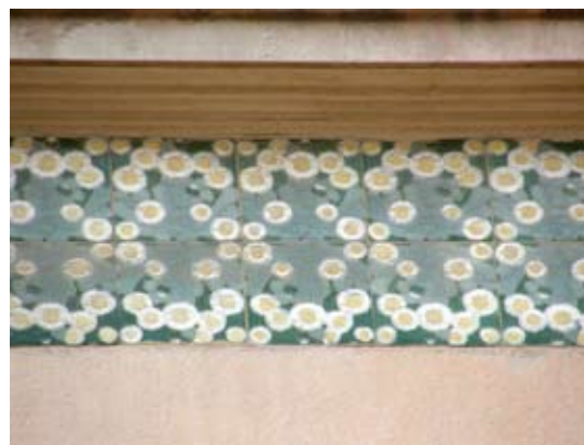
Вул. Бр. Рогатинців, 39