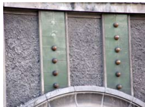
Вул. Котляревського, 25