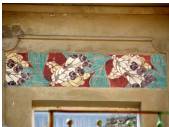
Вул. акад. Богомольця, 4 (1906 р.)