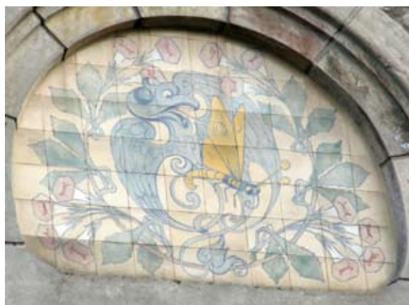
Вул. Наливайка, 9