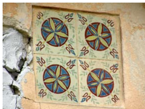
Вул. Коновальця, 110