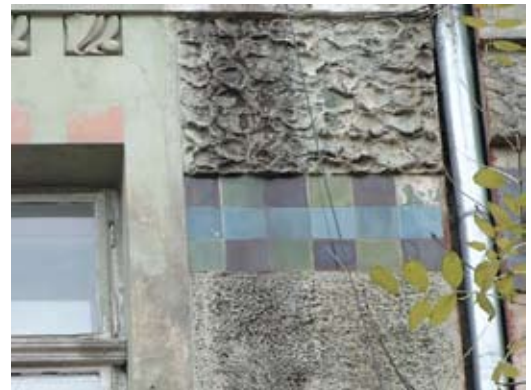
Вул. Донцова, 12