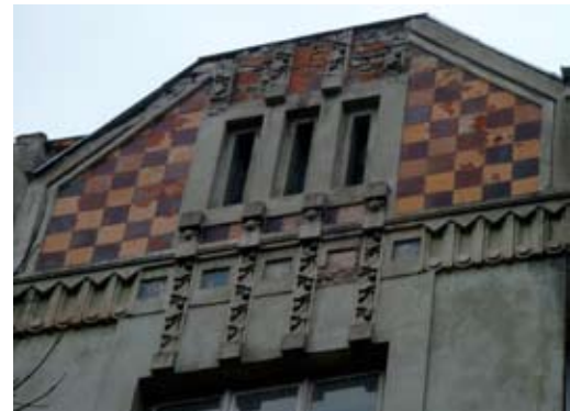
Вул. Донцова, 12 (контраст)