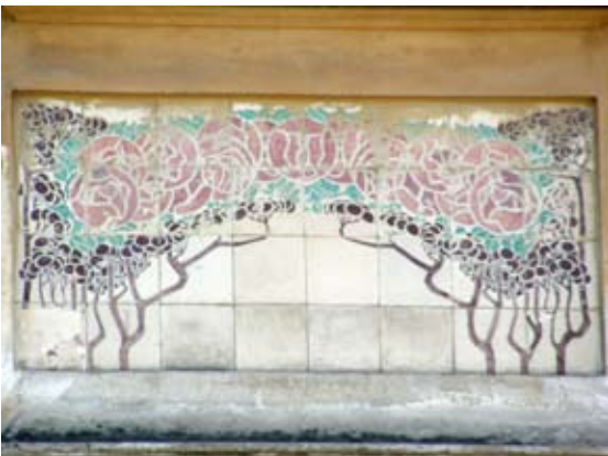
Вул. Личаківська, 70