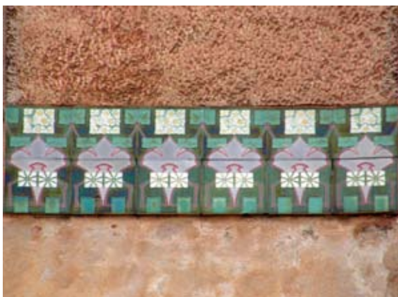
Вул. Шептицьких, 19 (1910 р.)