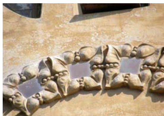
Вул. акад. Богомольця, 3