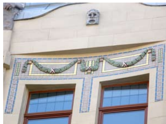
Вул. Коперника, 3