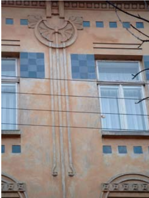
1 – вул. акад. Богомольця, 8