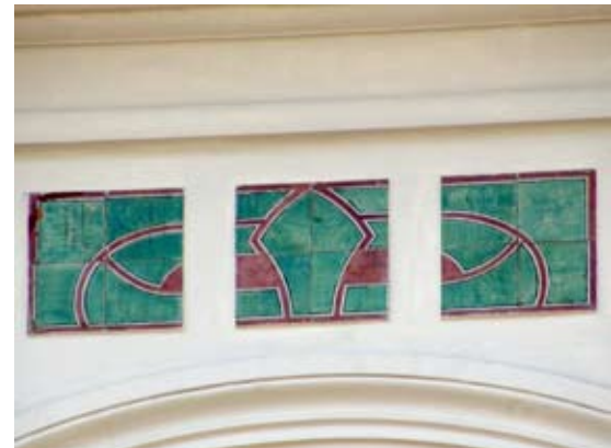
Вул. акад. Богомольця, 6