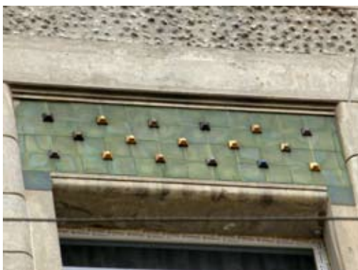
Вул. Хотинська, 1–3