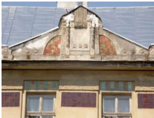
3 – вул. Донцова, 8–10