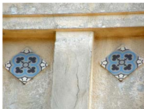
Вул. Вишеньського, 7-а