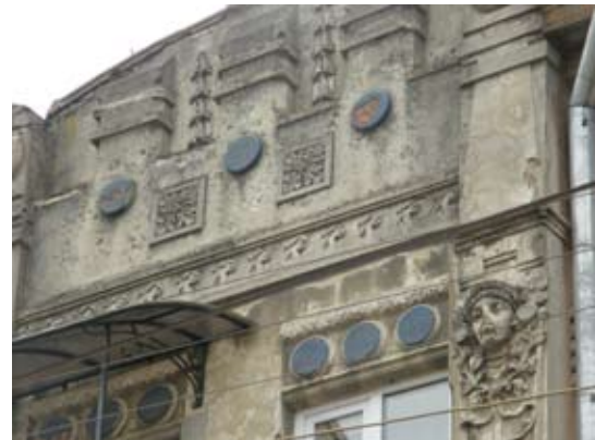
Вул. Нечуя-Левицького, 11-а