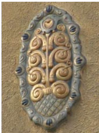
Іл. 1. Майолікові медальйони на фасадах орнаментальної сецесії