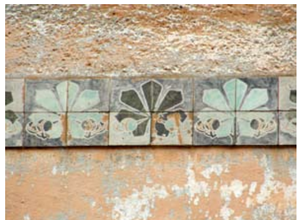
Вул. Шептицьких, 41 (1910 р.)