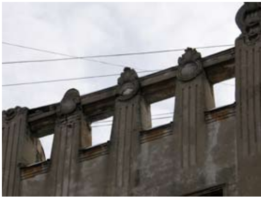
Вул. Дорошенка, 15 (майоліка зруйнована)