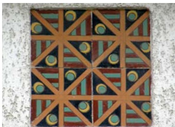
Вул. Коновальця, 108