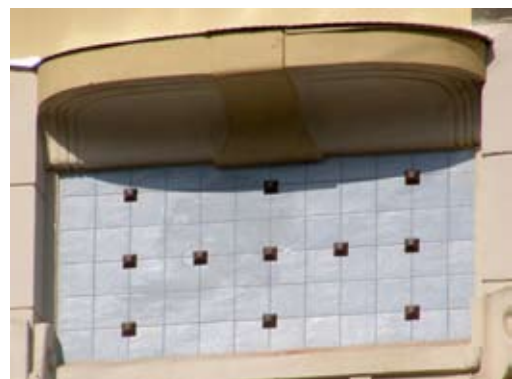
Вул. Нижанківського, 5