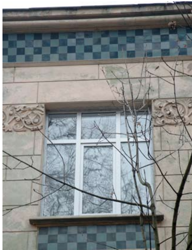
Вул. Богуна, 7 (контраст)