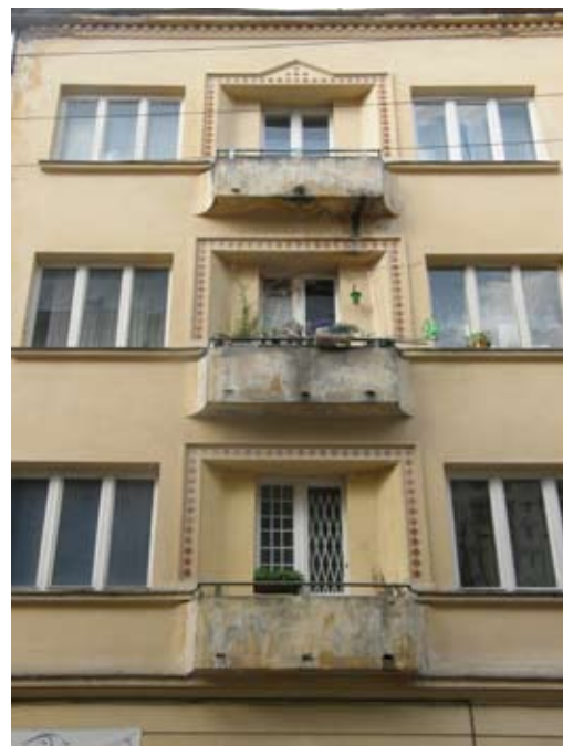
6 – вул. Ліста, 3

Іл. 12. Фрагменти фасадів, декорованих майолікою: 1–3 – орнаментальна сецесія; 4–5 – раціональна сецесія; 6 – Ар Деко