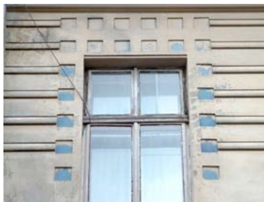
Вул. Донцова, 14