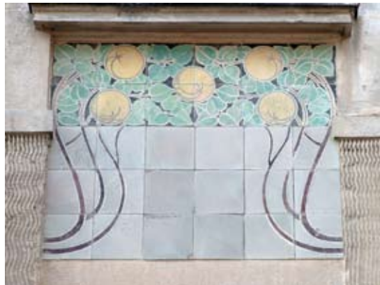
Вул. акад. Павлова, 4