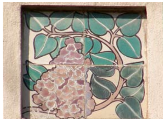
Вул. Наливайка, 9