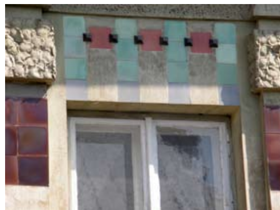
2 – вул. Донцова, 8–10