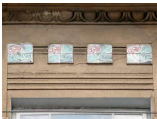
3 – вул. акад. Павлова, 1