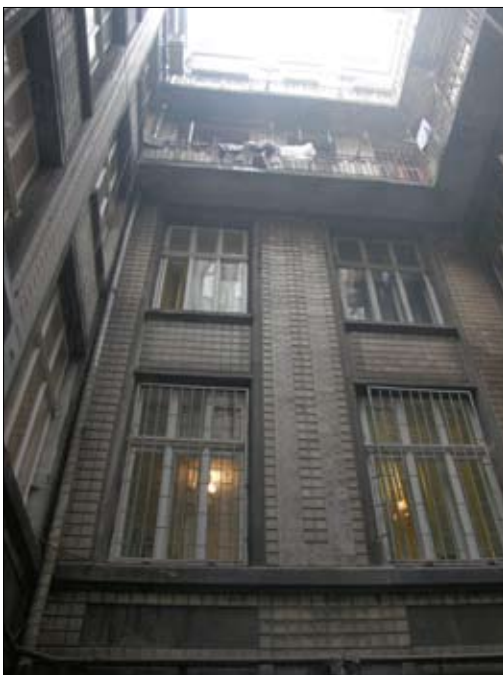
5 – вул. Галицька, 21 (подвір'я)