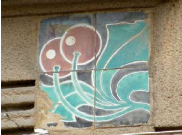
Вул. акад. Павлова, 1