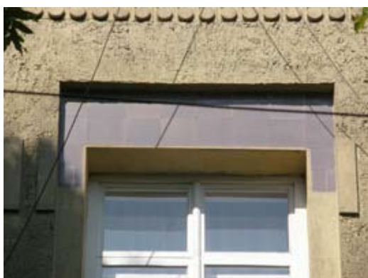
5 – вул. Донцова, 6