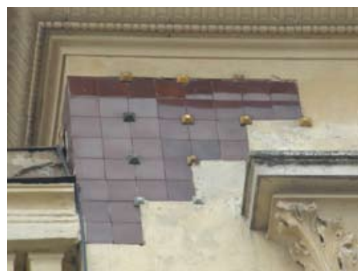
6 – вул. Кубійовича, 49