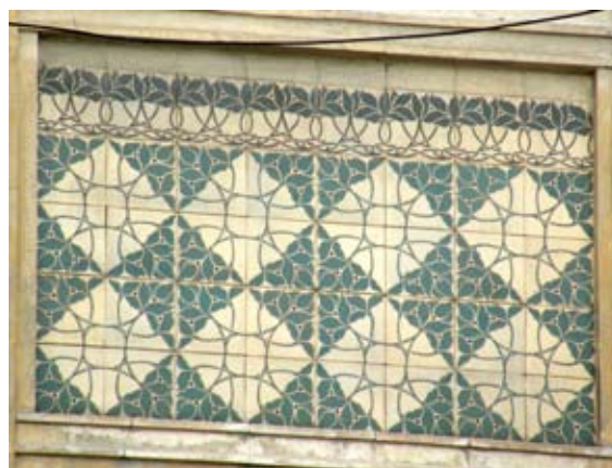
Вул. Руставелі, 8–8-а (1908 р.)