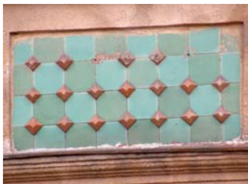
Вул. ген. Чупринки, 77