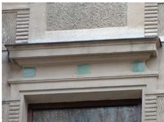
Вул. акад. Богомольця, 4