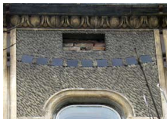
Вул. Менделєєва, 6