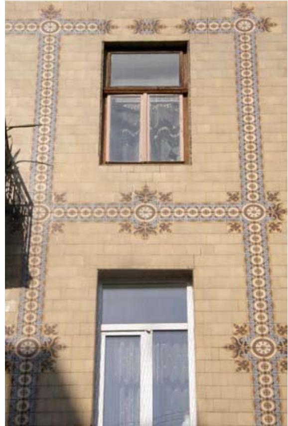
Вул. Курбаса, 5 (1907 р.)