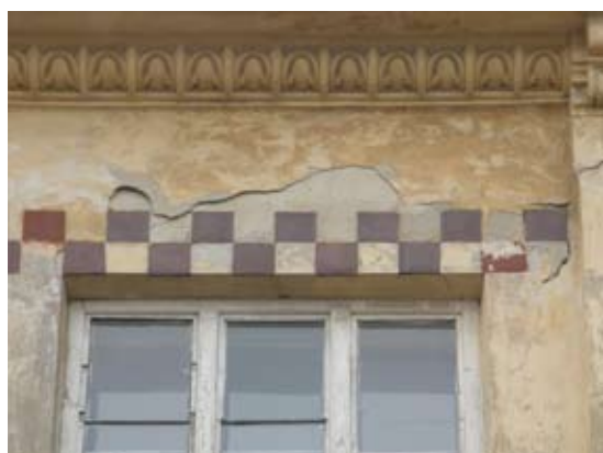
Вул. Кубійовича, 49