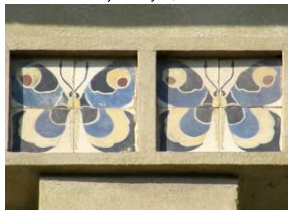
Вул. Наливайка, 9