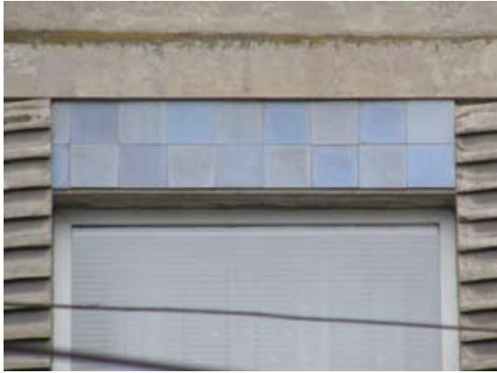
Вул. Руставелі, 44 (нюанс)