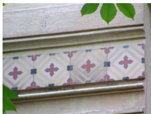
8 – вул. Вишеньського, 30

Іл. 6. Форма майолікових дзеркал на сецесійних фасадах: 1 – прямокутна горизонтальна; 2 – прямокутна вертикальна; 3 – квадратна; 4 – Т-подібна; 5 – П-подібна; 6 – трикутна сходяща; 7 – півкругла; 8 – фризоподібна