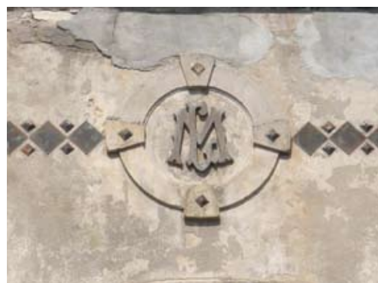
Вул. Хмельницького, 171