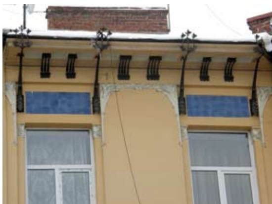
1 – вул. Руставелі, 18