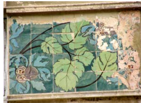
Вул. Богуна, 5