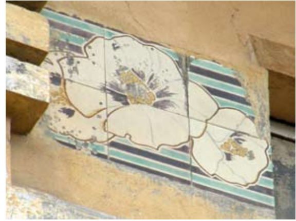
Вул. акад. Павлова, 3