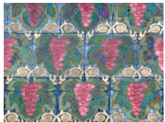
Вул. Тарнавського, 6–8