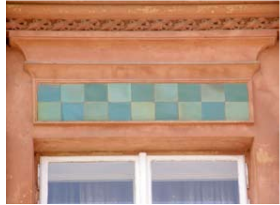
Вул. Архітекторська, 3