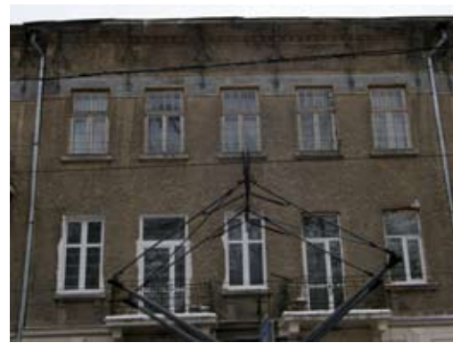
4 – вул. Франка, 69