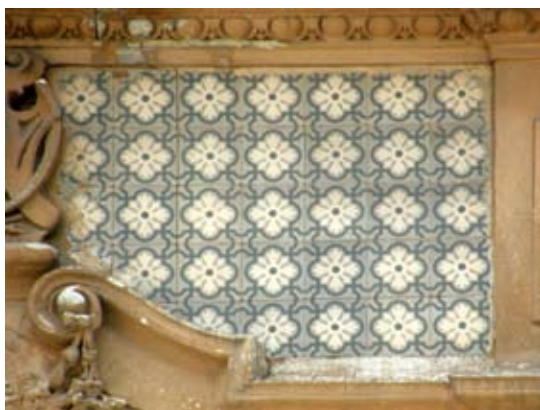
Вул. Стрийська, 3