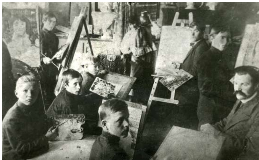
Заняття у Вечірніх рисувальних класах при Елисаветградському земському реальному училищі. Фото кінця XIX – початку XX ст.