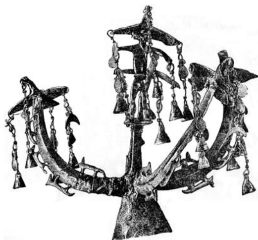
Ритуальне навершя. IV тис. до н. е., культура скіфів, Дніпропетровська обл.