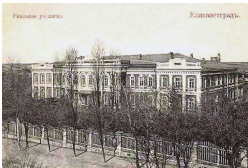
Елисаветградське земське реальне училище. Фотолистівка кінця XIX – початку XX ст.