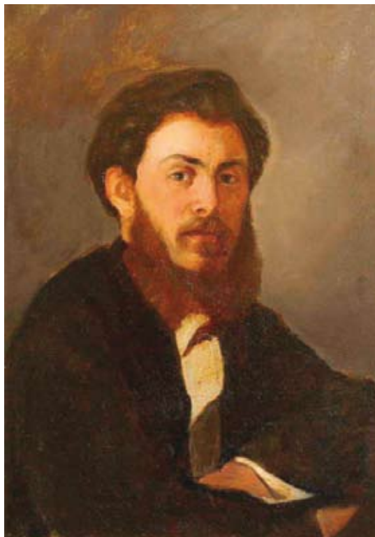
І. Велієв. Копія портрета П. Крестоносцева. Художня галерея, м. Углич (РФ)